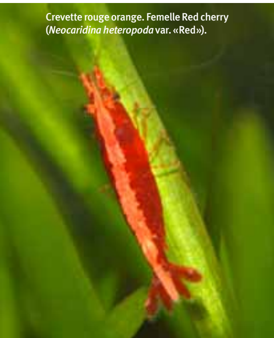
Crevette rouge orange. Femelle Red cherry ( Neocaridina heteropoda var. «Red»).

Ce type de bac permet de faire grandir quelques alevins sans que cela nécessite trop de maintenance, (par exemple pour les tétras cuivre, Melanotenia praecox , Tateurndina ...).