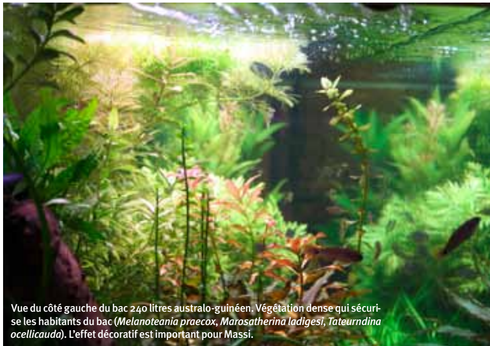
Vue du côté gauche du bac 240 litres australo-guinéen. Végétation dense qui sécurise les habitants du bac ( Melanotaenia praecox , Marosatherina ladigesii , Tateurndina ocellicauda ). L'effet décoratif est important pour Massi.