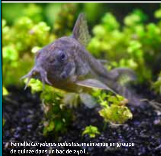
Femelle Corydoras paleatus , maintenue en groupe de quinze dans un bac de 240 L.

Le 240 L juste avant une bonne taille des plantes. Le sable noir fait mieux ressortir le contraste des plantes et sécurise les poissons. Avec 2 x 30 watts, de réflecteurs et une bonne fertilisation, il est possible de maintenir une végétation sans pour autant faire une énorme consommation d'énergie.