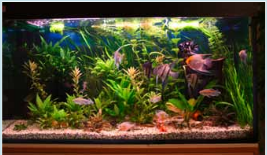
Le bac de 360 litres est le « bac des scalaires ».