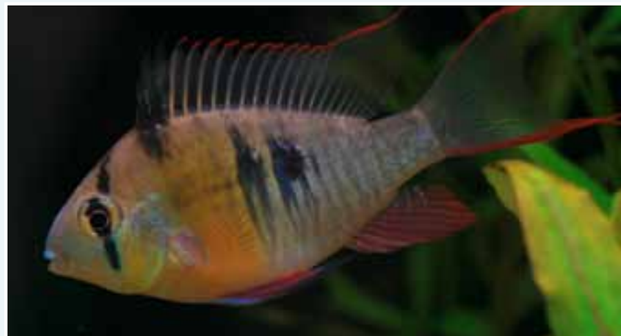
Jeune mâle Mikrogeophagus altispinosus . Plusieurs mâles peuvent cohabiter dans un 360 L, cependant il faut veiller à disposer le bac afin d'y avoir de nombreuses cachettes. Ce sont des poissons qui occupent la partie basse de l'aquarium.