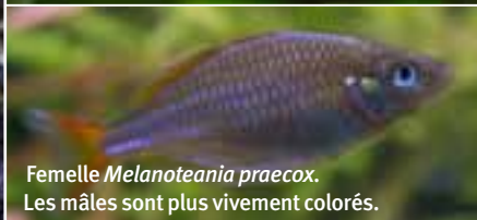
Femelle Melanotania praecox . Les mâles sont plus vivement colorés.