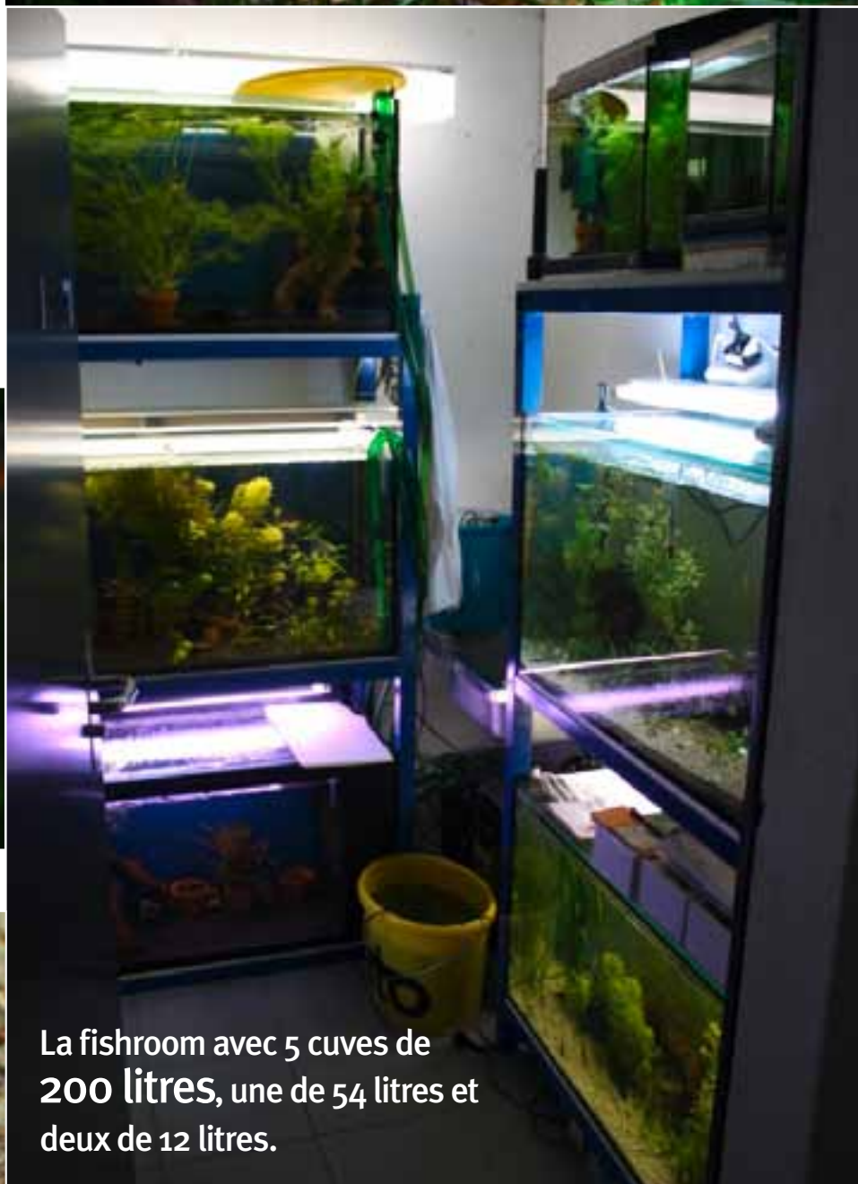
La fishroom avec 5 cuves de 200 litres, une de 54 litres et deux de 12 litres.