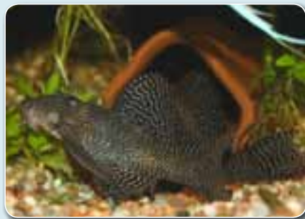
Deux mâles Hypancistrus sp. « Queen Arabesque » L260 se disputant pour le tube de ponte sous les yeux de la femelle qui est prête à pondre.

aux pieds des plantes à racines ( Echinodorus , Cryptocoryne ...) renouvelées tous les six mois environ. Des racines de mopani et beaucoup de plantes constituent un décor très naturel et reposant. L'eau vient directement du robinet.