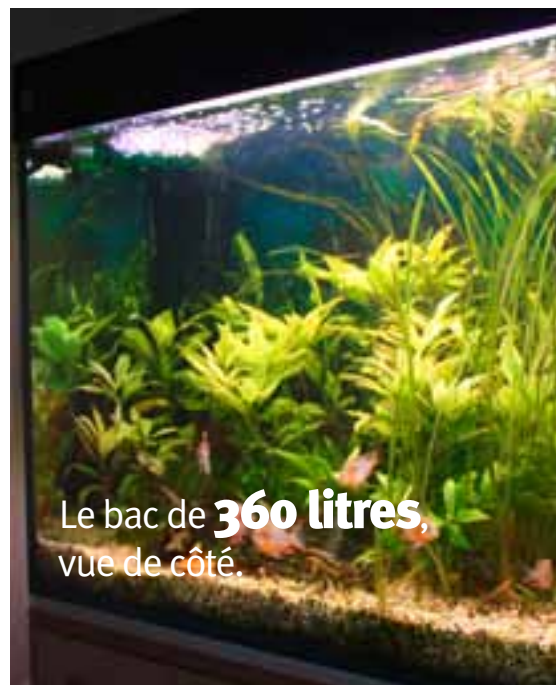
Le bac de 360 litres, vue de côté.