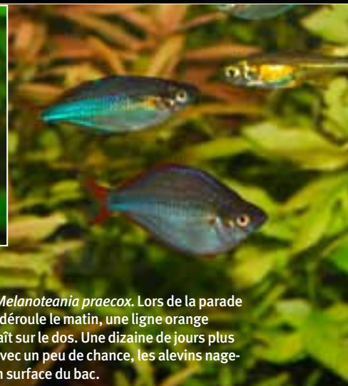
Mâle Melanotania praecox . Lors de la parade qui se déroule le matin, une ligne orange apparaît sur le dos. Une dizaine de jours plus tard, avec un peu de chance, les alevins nageront en surface du bac.