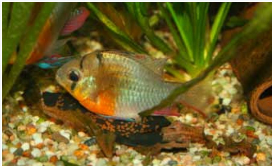
Ponte des Mikrogeophagus . Une ardoise, un couple, une nourriture variée et des changements d'eau réguliers, rien de tel pour avoir de belles pontes de ce magnifique poisson. Lors de la ponte des Mikrogeophagus altispinosus , les poissons reproducteurs se colorent d'un jaune-orange vif et l'oviducte de la femelle est bien visible.