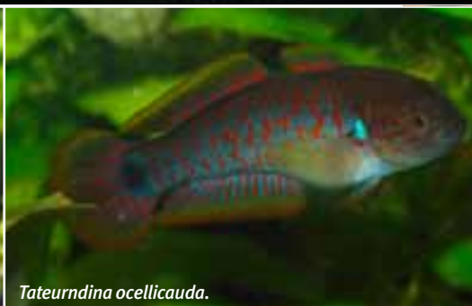
Tateurdina ocellicauda .