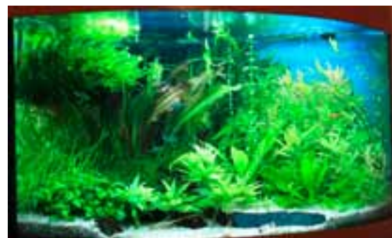
Le 190 litres est orienté Amérique du Sud avec de jeunes tétras cuivre des Corydoras panda et des Sturisomatichthys colombia .

L'installation tend vers la simplicité : le substrat est simplement composé de 5 à 10 centimètres de gravier fin avec quelques boules d'argiles