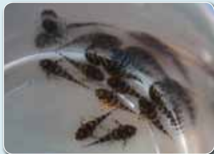
Jeunes Hypancistrus sp. « Queen Arabesque » L260 d'une douzaine de jours avec un reste de sac vitellin.