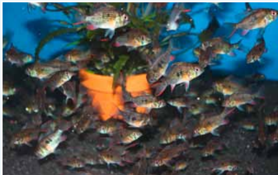
Jeunes Mikrogeophagus altispinosus d'environ sept ou huit mois, résultat d'une ponte de 400 œufs qui donna 350 jeunes viables et en bonne forme.