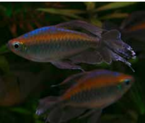
Corydoras gossei et Corydoras seussi , des reproductions maison.

Mâle Phenacogrammus interruptus , magnifique poisson robuste à maintenir en groupe de cinq ou six minimum qui demande un bon espace de nage. Poisson originaire du bassin du Congo.